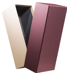
Top&bottom Scatola fondo-coperchio