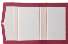
5 pieces cover Copertina 5 pezzi

Kissy è un'incollatrice con nastro aspirante per la produzione medio/alta di scatole di lusso e copertine.