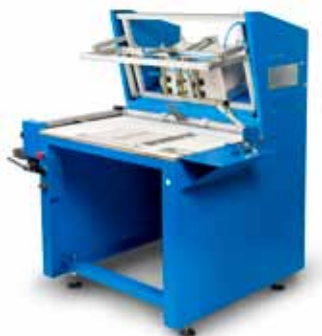
Roby Junior 2

Incollatrice/rimboccatrice Formato max: cm 50 x 70 Velocità: cicli/ora 250